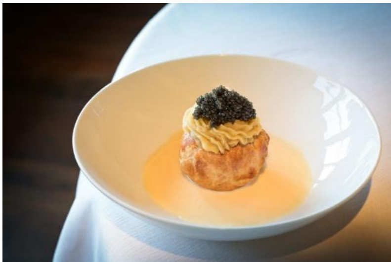
Omaggio a Vittorio Fusari

Preparazione: lavare la patata e farla cuocere con la buccia avvolta in carta alluminio in forno caldo o, meglio ancora, tra le braci del camino . A cottura avvenuta e la patata ancora calda, togliere una calotta alla patata e con un cucchiaino togliere un po' di polpa, nell'incavo ricavato mettere un pezzetto di burro salato e, sopra questo un cucchiaino abbondante di caviale malossol, servire subito su un piatto adeguato e decorato con fettine di limone del Garda.